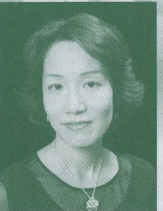
野々下由香里 Yukari Nonoshita (ソプラノ:企画3)

「もののけ姫」で一世を風靡し、グルベローヴァやコヴァルスキーとの共演でも話題を集める。1998年第12回日本ゴールドディスク大賞のベスト・クラシック・アルバム・オブ・ザ・イヤー、第21回日本アカデミー賞協会特別賞として初の主題歌賞を受賞。BISレーベルやキングレコードより多数のCDを発売。2004年、故郷の宮崎県西部市の「植樹祭」にて天皇陛下の前で歌を披露。2005年にはドイツのシュレースヴィヒ・ホルシュタイン音楽祭に出演し、好評を博した。